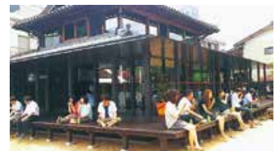
写真/プラットイーズ 神山センター (通称: えんがわオフィス)