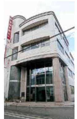
愛媛新聞社宇摩支社1F

(株)四国中央テレビ 宇摩支社2F(事務所) 3F(スタジオ、マシンルーム) 4F(編集室)